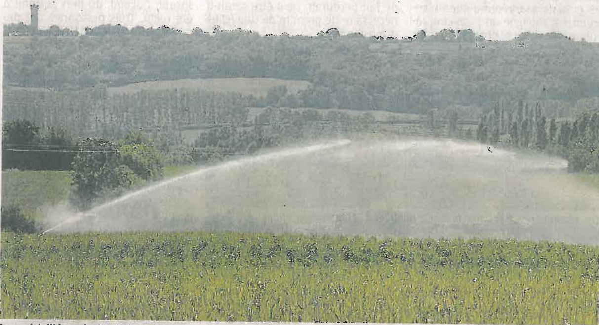
Les spécialités agricoles de la Vallée sont gourmandes en irrigation. Archives CO.

Vendredi 2 décembre, une conférence sur l'eau est organisée Espace du Séquoia à Corné en présence des agriculteurs, des écologistes et des élus.