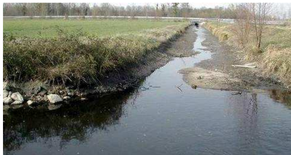
En 2004 déjà, la polémique faisait rage suite à la décision du préfet d'autoriser un nouveau prélèvement dans la Loire afin de préserver la nappe phréatique du Val d'Authion.

L'objectif affiché, c'est de mieux connaître l'état des prélèvements et de rationaliser l'usage qu'on en fait. L'association indique qu'elle n'acceptera dans ses rangs « que les irrigants qui sont en règle ou qui s'engagent à régulariser leur situation rapidement. » Cela ne signifie pas forcément qu'il y a plus de resquilleurs ici qu'ailleurs : « Jusqu'assez