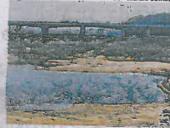
La Loire a un faible niveau lors de ces périodes de sécheresse.