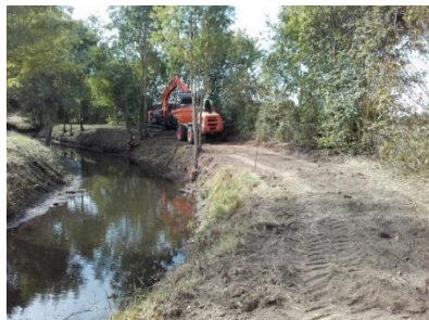
Déblais à partir des berges