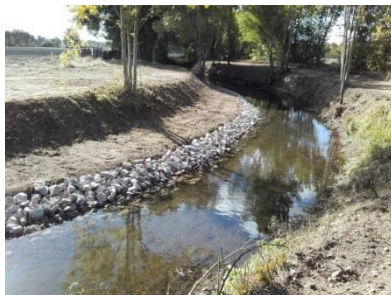
Création de banquettes empierrées