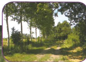
Chemin de halage