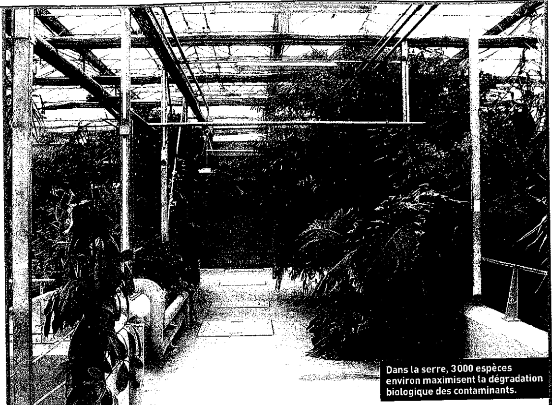
Dans la serre, 3 000 espèces environ maximisent la dégradation biologique des contaminants.

Ultrafiltration. Les techniques membranaires diffèrent : forme des membranes (plaque ou fibre), taille des pores... « Nous adaptons les membranes à chaque situation », constate Pascal Pluyaud. « Nous utilisons l'ultrafiltration. Avec des pores de 0,03 à 0,08 micron, les bactéries ne peuvent franchir la membrane », précise Valéry Geaughey. En termes de coût, l'investissement reste en général supérieur à celui d'une step classique. C'est le cas au Bono (Morbihan) : « Le surcoût à la construction était