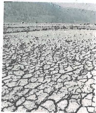
Un lac suisse largement asséché.