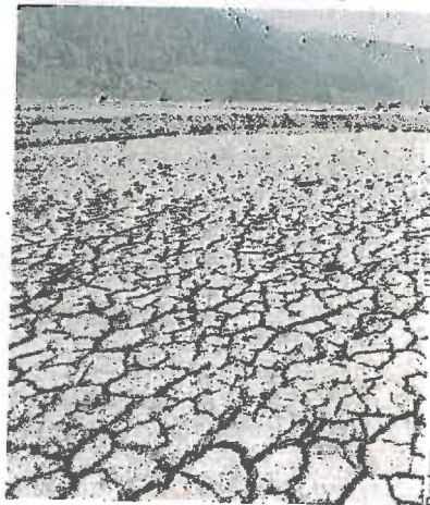
Un lac suisse largement asséché.

Ce printemps très sec s'explique par la position de l'anticyclone des Açores, situé au large de l'Afrique de l'ouest. Selon Franck Baraer, de Météo France, « cette année, pour des raisons que personne ne peut expliquer, il est décalé vers le nord. » Ces hautes pressions bloquent l'entrée des dépressions et donc « des pluies qui viennent de l'ouest ». Phénomène particulièrement rare : « L'Irlande et l'Écosse connaissent également la sécheresse, depuis trois mois », ajoute le climatologue. Cette situation de blocage touche également l'est de l'Europe jusqu'en Russie. A contrario , le Québec a subi de fortes pluies depuis quelques semaines.